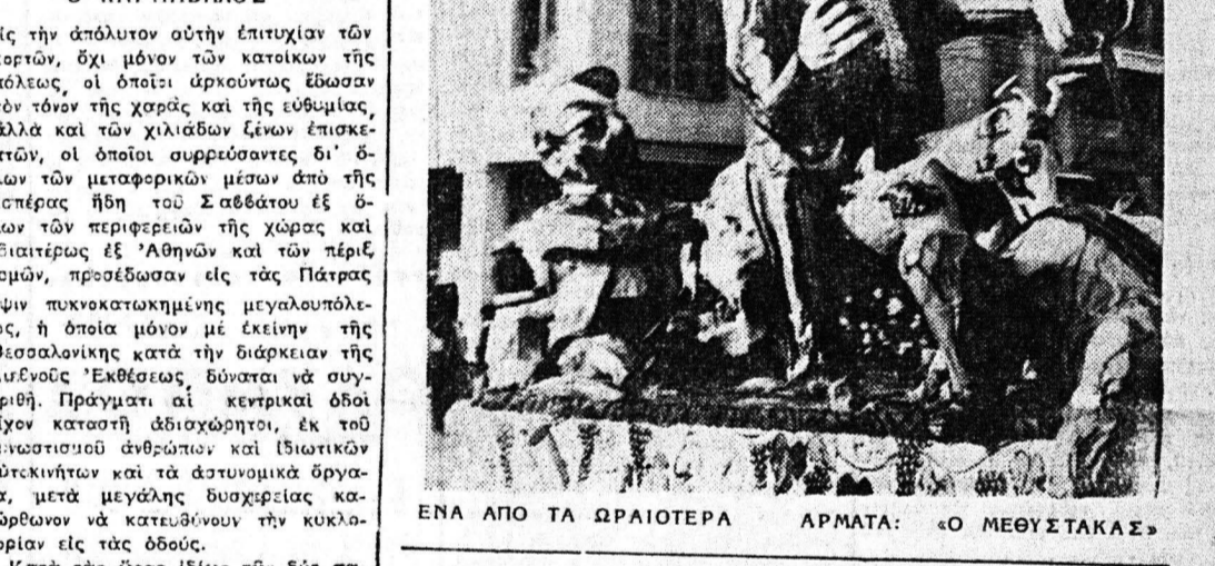
ΕΝΑ ΑΠΟ ΤΑ ΩΡΑΙΟΤΕΡΑ ΑΡΜΑΤΑ: «Ο ΜΕΘΥΣΤΑΚΑΣ»