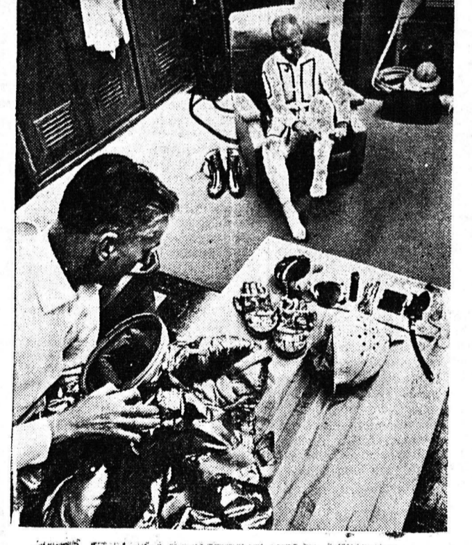
ΑΝΕΚΟΙΝΩΘΗ ΗΝ ΟΤΙ Ο ΑΜΕΡΙΚΑΝΟΣ ΑΣΤΡΟΝΑΥΤΗΣ ΤΩΝ ΓΚΛΕΝ ΘΑ ΑΝΑΒΑΗ ΕΚ ΝΕΟΥ ΤΑ ΚΑΘΗΚΟΝΤΑ ΤΟΥ ΕΙΣ ΤΟ ΑΚΡΩΤΗΡΙΟΝ ΚΑΝΑΔΑΣ. ΕΙΣ ΤΗΝ ΕΙΚΟΝΑ Ο ΓΚΛΕΝ ΕΝ ΗΝ ΟΤΙΟΜΑΖΕΤΟ ΔΙΑ ΤΗΝ ΙΣΤΟΡΙΚΗΝ ΤΟΥ ΠΤΗΞΙΝ. ΔΙΑΚΡΙΝΟΝΤΑΙ ΟΛΑ ΤΑ ΤΜΗΜΑΤΑ ΤΗΣ ΣΤΟΛΗΣ ΤΟΥ ΠΟΥ ΔΙΑ ΤΑ ΦΟΡΕΘΗ ΧΡΕΙΑΖΕΤΑΙ ΤΗΝ ΕΠΙΒΛΕΨΙΝ ΕΙΔΙΚΟΥ ΕΠΙΣΤΗΜΟΝΟΣ