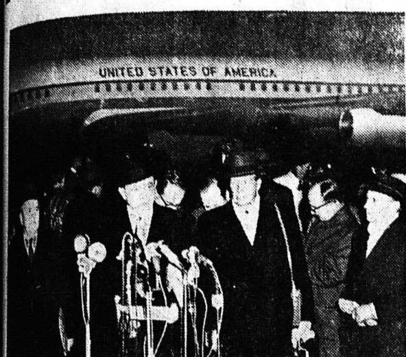
Αμερικανός υπουργός Έξωτερικου Ντ. Ράος ενώ μιλάει προς τους δημοσιογράφους, άμα τη αφορμή του εις Γενεύη.