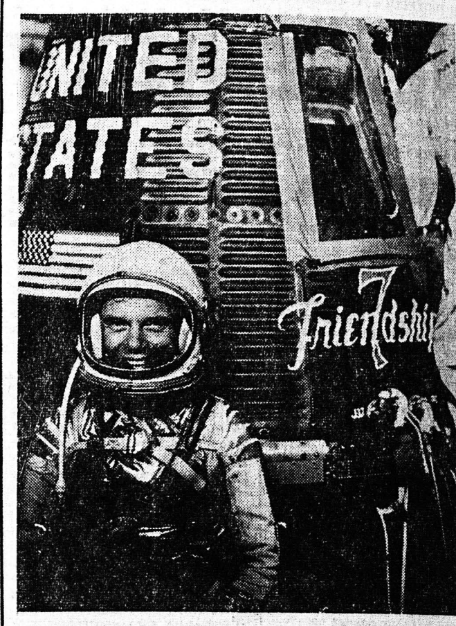
Μία ακόμη φωτογραφία του Αμερικανού αστροναύτη Γκάρντνερ...