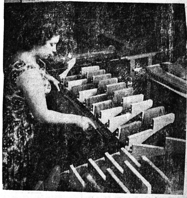
Πολλά παραγγέλαι έχουν γί νει εις τήν Βρετανίαν άπό τούς άλλων διά τό εικονιζόμενον μηχανήμα, τό όποιον έξέτερονέσται μέχρι 30 δωδεκάδας καλτών τήν ώρην