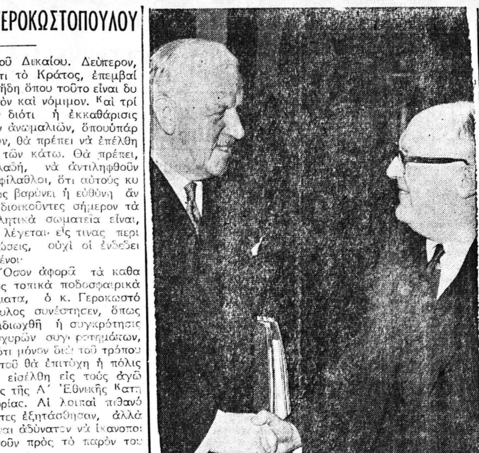
Αι Ηνωμένοι Πολίται προσηύχοντες... (Caption describing the photo above)

ΑΙ ΚΙΝΗΜΑΤΟΓΡΑΦΙΚΑΙ ΠΡΟΒΟΛΑΙ ΑΣΤΥΝΟΜΙΑΣ ΕΛΕΥΘΕΡΑ Η ΠΡΟΣΕΛΥΣΙΣ Το Κινηματογραφικό Συμπόσιον «Αστυνομία»... Θάνατοι Άναστασιος Σαραντοπούλου, 22 μηνών, Ζαφείρου Σατοπούλου, 80, Ιωάννης Κιάμος, 66, Διονύσιος Σενούλης, 61, Ιωάννα Ροδοπούλου, 58, Κωνσταντίνος Καρανής, 72, Στεφάνος Δουλαβέρης, 84, Δημήτριος Αραβόπουλος, 81, Κωνσταντίνος Λαδρινός, 78, Ζωή Κασσιώτη, 83, Φίλιππος Παντίνας, 63.