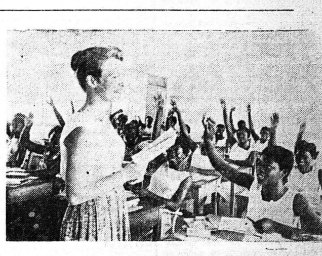
Αι φιλικές διακρίσεις... (Caption describing the photo above)

Ένας Αμερικανός Φιλέλληνας Η ΤΕΦΡΑ ΤΟΥ ΠΩΛ ΤΖΕΚΙΝΣ ΕΝΕΤΑΦΙΑΣΘΗ ΕΙΣ ΜΕΣΟΛΟΓΓΙΟΝ Πολύτιμον τό έργον του υπέρ της Ελλάδος Το χόμιον του Μεσολογγίου... (Article about the funeral of Paul Tzektis)