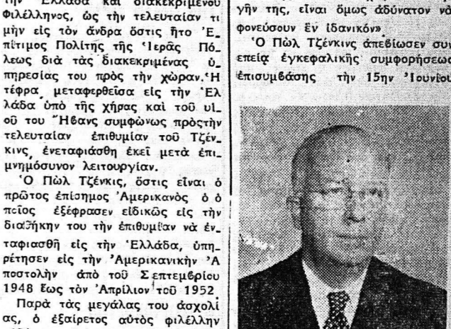
ΠΩΛ ΤΖΕΚΙΝΣ... (Caption of the portrait)

Ένας Αμερικανός Φιλέλληνας Η ΤΕΦΡΑ ΤΟΥ ΠΩΛ ΤΖΕΚΙΝΣ ΕΝΕΤΑΦΙΑΣΘΗ ΕΙΣ ΜΕΣΟΛΟΓΓΙΟΝ Πολύτιμον τό έργον του υπέρ της Ελλάδος Το χόμιον του Μεσολογγίου... (Article about the funeral of Paul Tzektis)