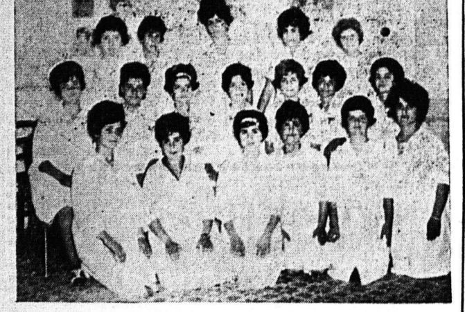
Έγγραφεισ σπουδαστρια διά την προσεχή περίοδον... Λεία εκπαιδευτική, Υποτροφία, Ένδομησίσις συνεχής εις την εξέλιξιν της τέχνης.