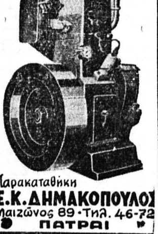
Παρακαταθήκη Ε.Κ. ΔΗΜΑΚΟΠΟΥΛΟΥ Μαζιώνας 89-Τηλ. 46-72 ΠΑΤΡΑΙ

Κολοκοτρώνη 34 ΤΥΡΕΛΑΙΟΜΗΧΑΝΑΙ ΑΠΟΤΟΛΙΔΗ ΘΕΣΣΑΛΟΝΙΚΗΣ 4,5 - 6,5 - 12' Πίπλω τετρακρόνοι-ζούλερ Ντιζελ αι πλέον εύχρηστοι και ποιοτικώς ανώτεροι