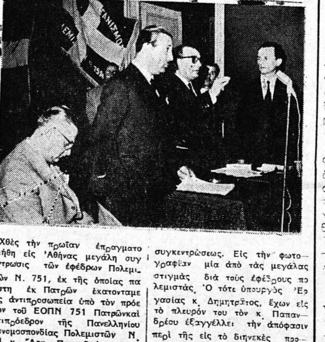
Χέρις των πρώτων έπραγματοποιήθη εις 'Αθήνας μεγάλη συγ-... Η Αλβανία προσβάλλει τον Ελληνικό χώρο...