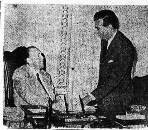
Ο ΝΕΟΣ ΔΙΟΙΚΗΤΗΣ ΛΙΜΗΣ ΣΥΝΟΜΙΛΕΙ ΜΕΤΑ ΜΟΜΦΕΡΡΑΤΟΥ