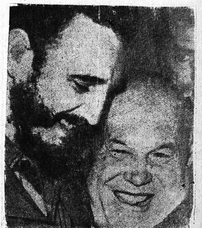
ΚΡΟΥΣΤΣΕΦ ΚΑΙ ΚΑΣΤΡ Ο: Άνήγειρον βάσεις διά τήν έκδόσιν, άλλα δέν έπρόλαβον