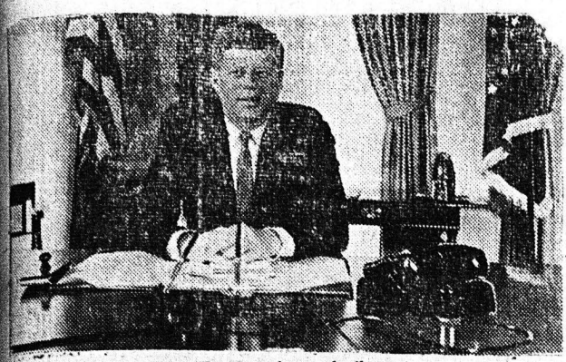
KENNENTY: Σταθ έρος και άκαμπτος