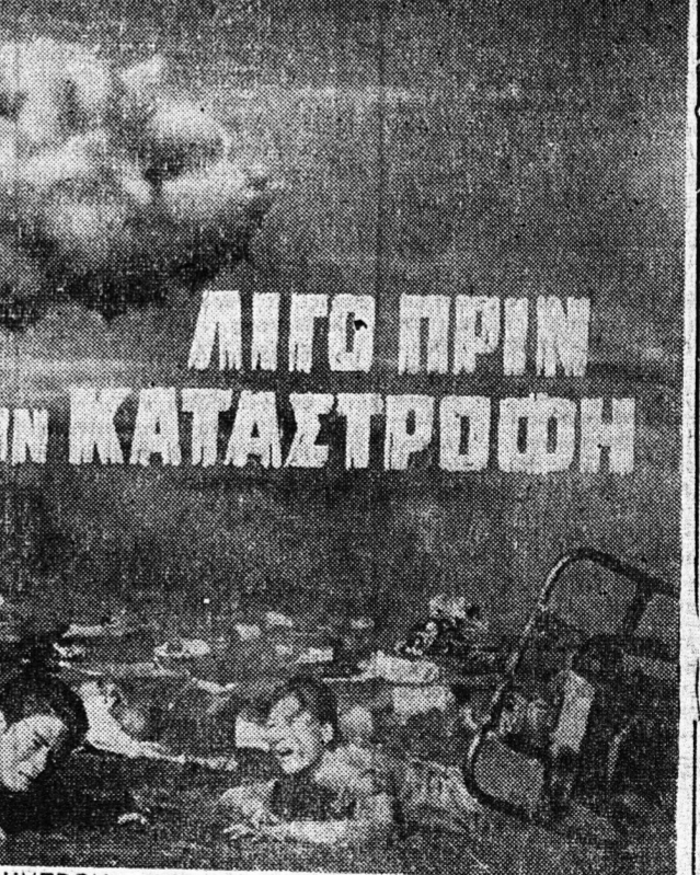
ΤΟ ΤΙ ΘΑ ΣΥΜΒΗ ΣΕ ΕΝΑΝ ΘΕΡΜΟΠΥΡΗΝΙ ΚΟΝ ΠΟΛΕΜΟ ΤΟ ΑΠΟ- ΚΑΛΥΠΤΗ Η ΤΑΙΝΙΑ ΑΥΤΗ ΣΙΝΕΜΑ ΣΚΟΠ — ΑΚΑΤΑΛΛΗΛΟΝ

ΕΛΑΣΤΙΚΑ PIRELLI Σ. ΦΙΛΙΠΠΑΚΗΣ ΑΓ. ΑΝΔΡΕΟΥ 37 ΤΗΛ. 34-56 - ΠΑΤΡΑΙ