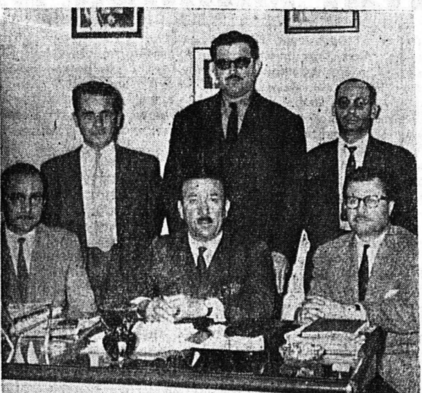
Εις τήν φωτογραφίαν τόν Διοικητικόν Συμβούλιον του νεοϊδρυθέντος 'Οργανισμού 'Εργαζομένων 'Ελλήνων Πολεμιστών Ν. 751 — 1836 — 2657, αϊοθάναται τήν ανάγκην τήν κρίσιμον και ιστορικήν αΰ- τήν ώσαν άπευθυνόμενος προς ήμās, τήν ύπερόχον έλλη- νικήν παραγωγικήν τάξιν, προς ήμās τούς διομηχάνους τούς επαγγελματιοβιοτέχνους και επιχειρηματίας διά να σάς διαθεωρώσασθε και να ύποσχεθή, ότι εις τόν δύστο- λον έργον τόν όποιον επιτί- πτει εις τούς ώμους σας, ότι ύσταται συμπαράστατός σας, ύσταται έτοιμος να σάς πα- ρόσχη τήν βοήθειαν εκείνην, που θα σάς επιτρέψη να φέ- ρετε εις πέρας τήν νέα άπο- στολήν σας: Να φέρετε δη- λαδή τήν Ελλάδα εις τόν έπι- τεύον διαβιώσεως των προη- μέτων λαών της Ευρώπης. Καί δέν ζήτουσι οι Έφεδροί εργαζόμενοι Πολεμισταί από ήμās κατά τήν εκπλήρωσιν του καθήκοντός των παρά άλλην καταπόνησιν, άλλην άνα- γώνισιν του παραγόντος που λέγεται «άνθρωπος» και έν τελευταία άναλύσει άναγώνι- σιον τόν μόχθον των και απόδοσιν δικαιοσύνης εις ό- τήν άφορή τήν ήθικήν και ύλι- κήν άμοιβήν της εργασίας των.

Οι Έφεδροι Πολεμισταί Ν. 751, δέν είναι μόνον οι ή- ροες των μαχών. Καί δέν ε- χουν ως άποστολήν των μόν- ον να είναι άνά πάσαν στι- γμή έτοιμοί να προσπίσουν τα ίερά έδάφη της πατρίδος Άπεδείχθησαν επίσης πρω- τοπόροι εις τόν αγώνα της Ειρήνης και της άνασυγκρο- τήσεως.