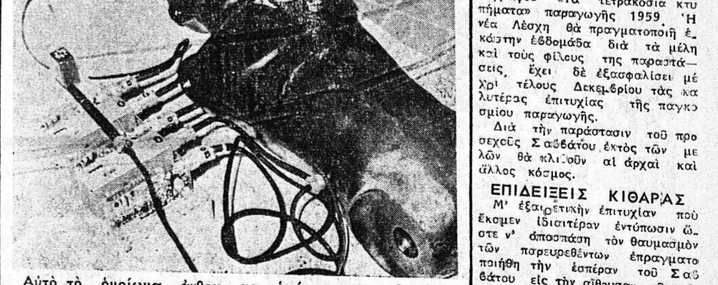
Αὐτὸ τὸ ὄργανο ἀνθρώπινου ὄργανου...