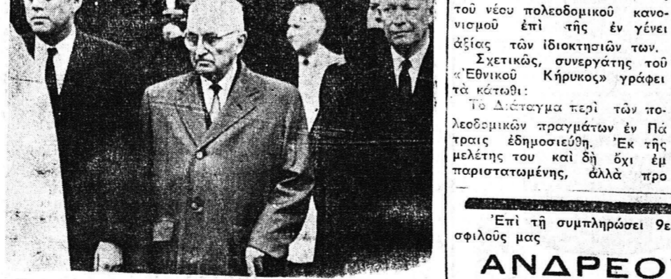
Ἡ κηδεία τῆς Ἐλεονώρας Ρουδέλτ...