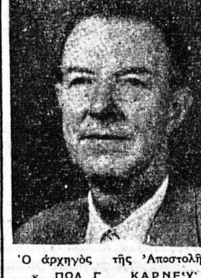
Ο αρχηγός της Αποστολής...