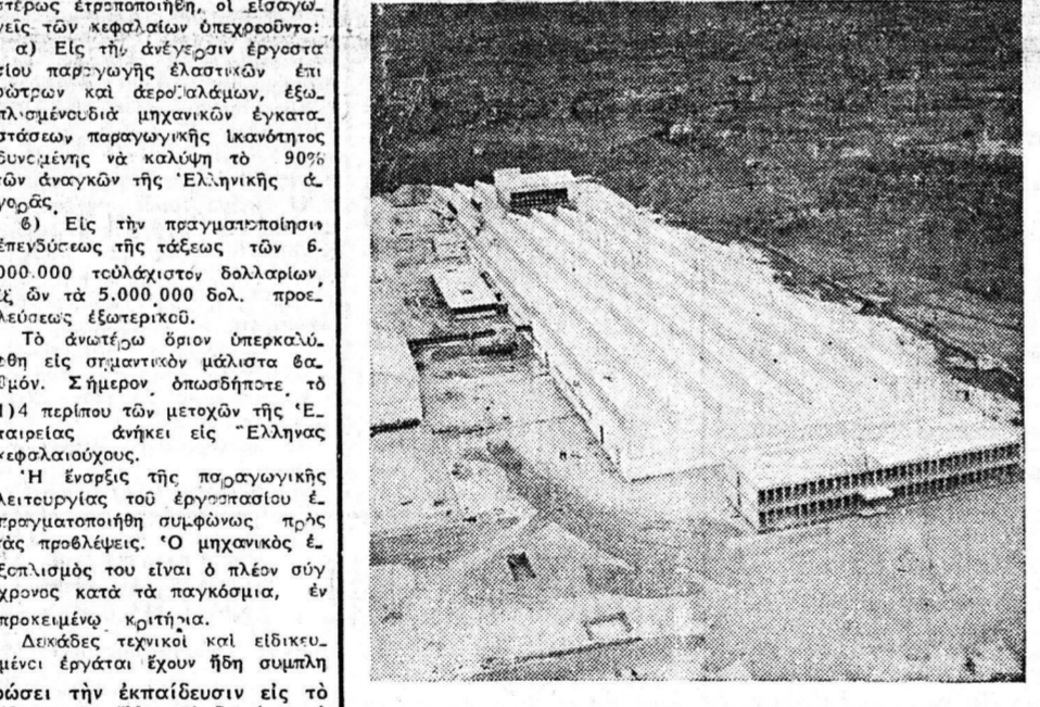
Η νέα βιομηχανία ΠΙΡΕΛΛΙ-ΕΛΛΑΣ