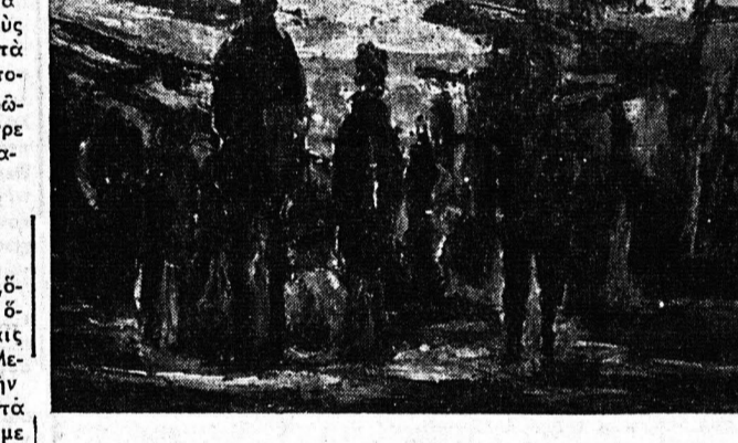
«Ενας επιθλητικός τύπος...» «Ενας επιθλητικός τύπος...» «Ενας επιθλητικός τύπος...»

Είς την Ισόγειον αίθουσαν...» Είς την Ισόγειον αίθουσαν...» Είς την Ισόγειον αίθουσαν...»