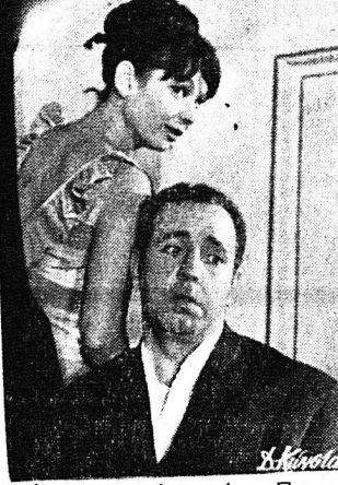
Η αγαπητή στους Πατριώτες...