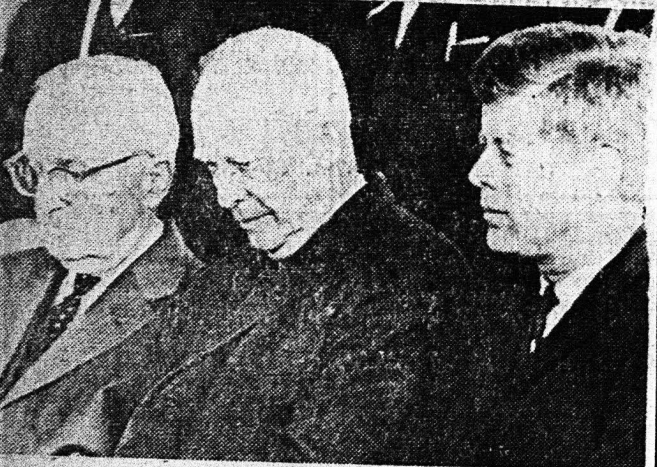
Πρόεδροι τών ΗΠΑ: Τρούμαν, 'Αϊζενχάουερ, Κένεντυ

και πολλοί άλλοι άνώτεροι ά είματσούκι τών 'Ηνωμ. Πολιτειών. Εάν ζούσε ο πρόεδρος Κένεντυ κατά τόν Γαλλικόν τύπον θα χειρίζετο διαφορετικά την κρίσιν εις τό Βιετνάμ, και θα ελάμβανε τούλάχιστον την έγκρισιν τών συμμάχων κρατών της Λατινικής 'Αμερικής πρό της άποθίδασεως 'Αμερικανικών ναυαγισμιά των εις τόν 'Αγιον Δομινίκον. Είναι δύσκολον να διαφανήση κανείς με τόν Γαλλικόν τύπον όσον άφορά την διαφοράν που ύπρχε μεταξύ δύο διαφορετικών άνδρων όπως ο πρόεδρος Τζόνσον και ο προκάτοχός του όπως είναι επίσημα δύσκολον να άποφανή