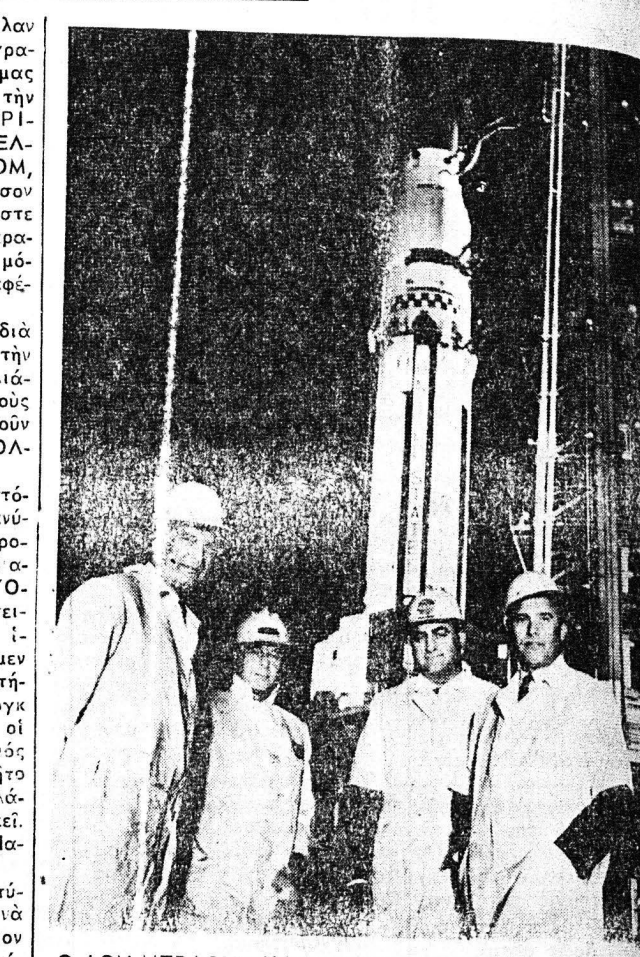
Ο ΦΟΝ ΜΠΡΑΟΥΝ ΚΑΙ Ο ΚΡΟΝΟΣ. Ο Δρ. Φόν Μπράουν, δεξιά—με συνεργάτες του και όπισθεν ο πύραυλος ΚΡΟΝΟΣ ο όποίος κατασκευάσθη συμφώνως πρός οδηγίαις του

Παρακολουθήσαμεν τας θυρίλλας κατά τόν σχηματισμόν των και μετεδώσαμεν εις άλλε μέρη τού κόσμου ιστορικά γεγονότα αυτούσια με τούς δορυφόρους τηλεοράσεως. Αυτά και άλλα είναι θαυμάσια επιτεύγματα, άλλα θα είναι ώς νάνοι άναμετρούμενοι με γίγαντας όταν θα έπυκοιούθησιν οι προσεχείς κατακτήσεις μας. Μία από αυτάς θα είναι η προσεγίωσις τού άνθρώπου εις την Σελήνην. Υπάρχει όμως η εσφαλμένη έντύπωσις ο μόνος σκοπός τού 'Αμερικανικού διαστημικού προγράμματος είναι να θέση τόν πόδα του εις την επιφάνειαν της Σελήνης ο άνθρώπος. Η ΝΑΣΑ εκτελεί πρόγραμμα ορύττης άεσας. Οι μη επηρνώμενοι δορυφόροι της και τό διαστημολογία της έσημείωσαν τερα-