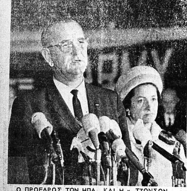
Ο ΠΡΟΕΔΡΟΣ ΤΩΝ ΗΠΑ ΚΑΙ Η κ. ΤΖΟΝΣΟΝ

εις εγκαταστήσας τούς πυράλους του 100 μίλια από τήν Μαϊάμι. Επικολούθησε η ιστορική άναμέτρσις που έφερε τόν κόσμον εις τού χείλους της άτομικής άδύσουσιν κατά την όποιαν ο Κρούτσεφ υπεχώρησε και άπευρε τούς πυράλους του από τήν Κούβαν. Είναι δύσκολον να πιστέψη κανείς ότι εάν ζούσε ο πρόεδρος Κένεντυ θα έπεδικινε διαταγούδς διπλωματικής έτι κίτας προκείμενός να άντιμετωπίση την κρίσιν εις τόν 'Αγιον Δομινίκον. Ποία και πόσον διαφορετική θα ήταν η κατάστασις εις τήν Κούβαν σήμερον εάν ο πρόεδρος Κένεντυ έδινε την έγκρισιν του δια την άεροπορικην συνδρομήν που τού εζητήθη από τούς φυγάδας της Κούβας είναι τού ερώτημα που θα έκανε πολλές φορές ο ίδιος ο πρόεδρος Κένεντυ. Είναι τώρα καταφανές ότι ο πρόεδρος Τζόνσον προτίμησε να κατηγορηθή δια την έλλειψιν διπλωματικού τάκτ, παρά δια την δημιουργίαν μίας νέας Κούβας. Ο στρατηγός Ντέ Γκάλ που κατέκρινε την απόδασιν 'Αμερικανικών στρατευμάτων εις 'Αγιον Δομινίκον δεν έδιστασε να άποστείλη Γάλλους άλεξιπτωτιστάς εναντίον μίας άναρχικής μειονότητας εις τήν πρώην Γαλλικήν κτίσιν της 'Καμπόν.