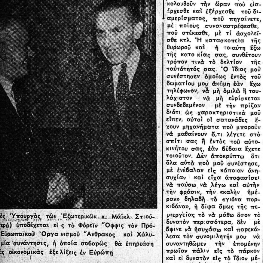
Ο Υπουργός τών Έξωτερικῶν κ. Μάικλ Στιούαρτ.