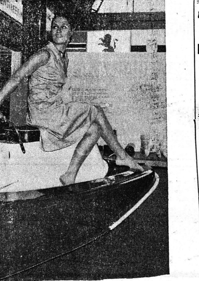
Το οικονομικόν πλαστικόν θάλασσιον σκούτερ κατασκευασέν έν υπό Βρετανικής Βιομηχανίας είναι έφοδισμένον με έξωλεβιον μηχανήν καί κατασχεύομενον άπό ίναν Νηγηνκλας. Έπεδείχθη εις τήν πρό σφαιον Διεθνή Έκθεσιν Πλαστικῶν Ευρώπης εις Λονδίον.