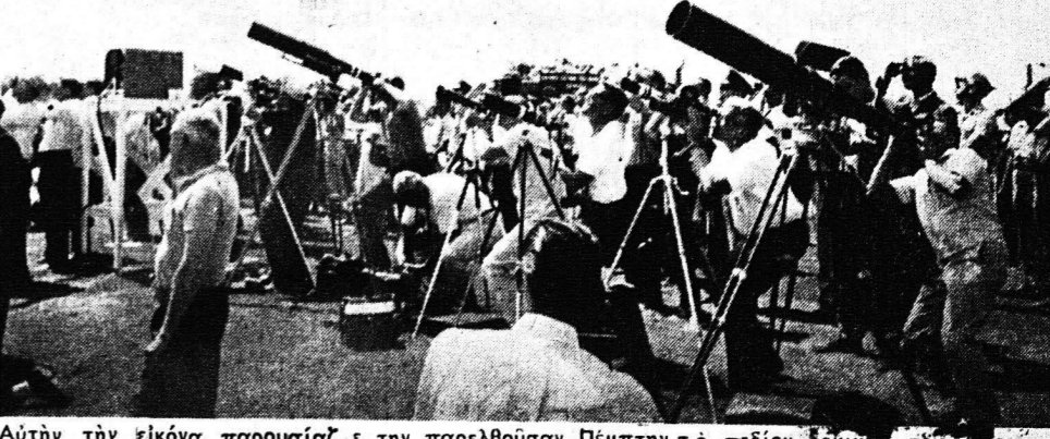
Αύτην τήν εικόνα παρουσιάζει η παρελθούσα Πέμπτη τού πεδίου δοκιμῶν τού Αεροπλάνου Κένεντυ, όταν εξετοξυθή νέον μέγα διαστημόπλοιο προς εξερεύνησιν τού διαστήματος. Δεκάδες δημοσιογράφοι καί έπιστημόνα με παν τούς είδους διόπτρας, παρακολουθούν τού μεγαλειώδες θέαμα, καθώς ή πύραυλος ανήρχετο εις τού διάστημα.

ΑΘΗΝΑΙ. Έντύπωσιν ή ξειρητικόν προέκλεσε μετά ξυ τού πολιτικού κόσμου δλων τών άποχωρήσεων ή διαίτης τής επιθέσεως τήν όποιαν ή Διευθύντρια τής «Καθημερινής» κ. Έλένη Βλάχου, έξέτασε εναντίον όλων τών βουλευτών, τούς όποιους άπο καλεί άποκαλύπτω φεύστας. Η πρωτοφανής αύτή επίθεσις περιέχεται εις χρονογράφημα τής κ. Βλάχου, έν κατα κλειδί τού όποιου άφερόνται καί τά έξής: