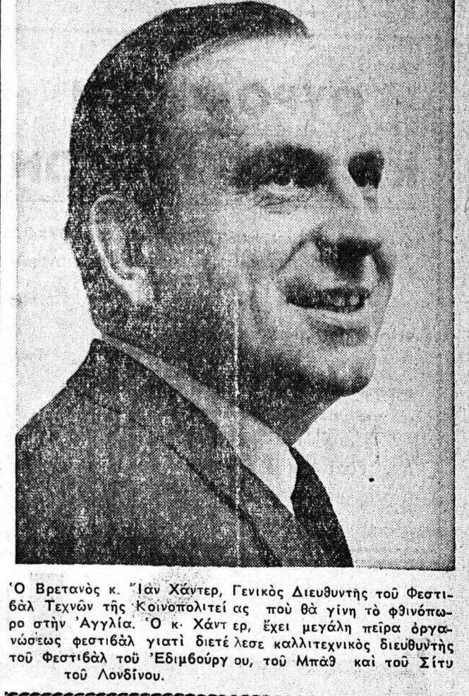
Ὁ Βρετανὸς κ. Ἰὼν Χάντεν, Γενικὸς Διευθυντὸς τῆς Φοιτικῆς Τεχνολογίας τῆς Κοινοπολιτείας, ὅπως εἶναι τὸ φθινόπωρον στὴν Ἀγγλία.

Ὁ Βρετανὸς κ. Ἰὼν Χάντεν, Γενικὸς Διευθυντὸς τῆς Φοιτικῆς Τεχνολογίας τῆς Κοινοπολιτείας, ὅπως εἶναι τὸ φθινόπωρον στὴν Ἀγγλία. Ὁ κ. Χάντεν, ἔχει μεγάλην πείρα ἐργαστηρίων φοιτικῶν γιὰτι διέτελε καλλιτεχνικὸς διευθυντῆς τοῦ Φοιτικῆς τοῦ Ἐδμβούργου, τοῦ Μπᾶθ καὶ τοῦ Σίτυ τοῦ Λονδίνου.