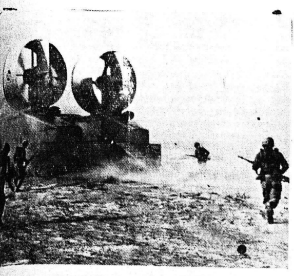
ΤΟ ΙΠΤΑΜΕΝΟΝ ΑΕΡΟΠΛΑΝΟΝ

ΗΔΗ ΕΥΡΙΣ ΚΕΤΑΙ ΕΙΣ ΤΗΝ ΥΠΗΡΕΣΙΑΝ ΤΟΥ ΣΤΡΑΤΟΥ ΤΩΝ Η. ΠΑ.