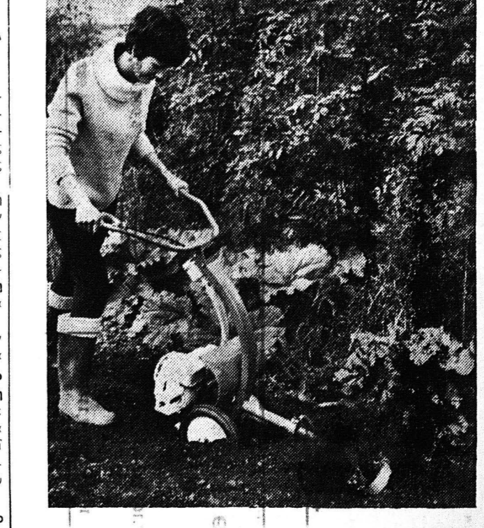
Εις την Διεθνή "Εκθεσιν Οικιακών και ειδών κικαλαριών της Κολωνίας επεδείχθη και ο Βρετανικός αυτός περιγραφικός καλλιερητής, ο οποίος είναι πολύ κατάλληλος διά έρασιτέχνας βσον και επαγγελματίας κηπουρούς. Ονομάζεται Λάντμαστερ 65.