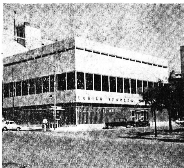
Τό νέον κτίριον εις τό όποιον άβά στεγασθή τό 'Υποκατάστημα της 'Εθνικής Τραπεζής Πατρών είναι έτοιμον και άβά άπομένον παρά λεπτομερείαν μόνον. 'Η φωτογραφία του καλλιμαρμού και επιβλητική μέγασρον της πλατείας Βασιλέως Κωνσταντίνου, τό όποιον κοσμή την πόλιν, έλήφθη την μεσημέριαν τό Σάββατον. Συντόμως άβά άναγγελθή και ή ήμερομηνία τών έγκαινίων του