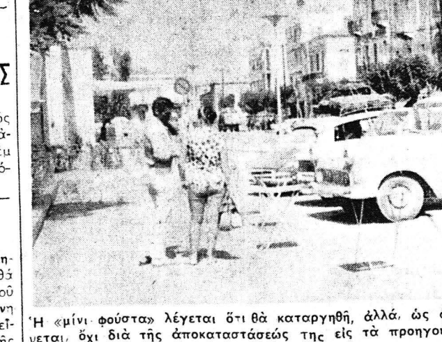
—'Η μίση φούστα λέγεται ότι άά καταργηθή, αλλά, ός φαίνεται, όχι διά τής άποκαταστάσεως τής εις τά προηγούμενα μήνη! Τό πιθανώτερον είναι ότι θάοιμεν μάλλον προς πλήρη καταργησθ τής όλης τουριστικής ύπόστασιν ή άνωτέρω φωτογραφία μίας όμας τουριστριών χθες τήν μεσημέριαν έξωδύ του καφενείου του σιδηρ. σταθμού Πατρών

—'Η εξωτερική πολιτική 'Εξωτερική πολιτική τής 'Ενωσεως Κέντρον παρεμφερεί άμετάβλητος.