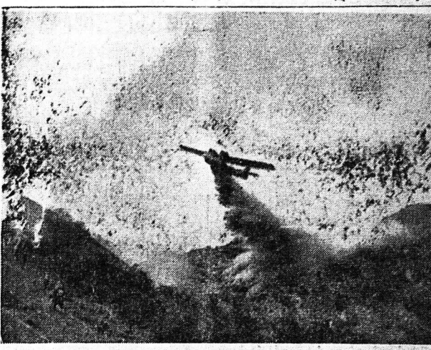
Οι 'Αμερικανοί τελειοποιούν συνεχώς τήν 'Υπηρεσίαν Καταστέλλουσας Πυρκαϊών εις όσα. Τελευταία ήρχισεν η χρησιμοποίησις και άεροπλάνων, τά όποια σκορπίουν μίαν είδικήν ουσίαν άναστολήτικη του πυρός, διότι σχηματίζει ένα είδος «νεκρός ζώνης». Είς τήν είκόνα ένα άεροπλάνο κατά τήν διάρκειαν δοκιμής.