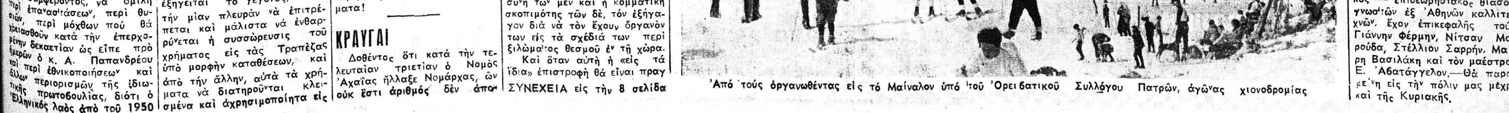
Από τούς οργανωθέντας εις τό Μαύινλον υπό τού 'Ορειβατικού Συλλόγου Πατρών, άγώνας χιονοδρομίας

ΕΙΝΑΙ ΔΥΝΑΤΗ Η ΑΝΑΠΤΥΞΙΣ ΚΑΙ ΧΕΙΜΕΡΙΝΟΥ ΤΟΥΡΙΣΜΟΥ ΤΕΡΑΣΤΙΟΝ ΤΟ ΟΦΕΛΟΣ ΑΝ'ΑΞΙΟΠΟΙΗΘΗ ΤΟ ΠΑΝΑΧΙΚΟΝ