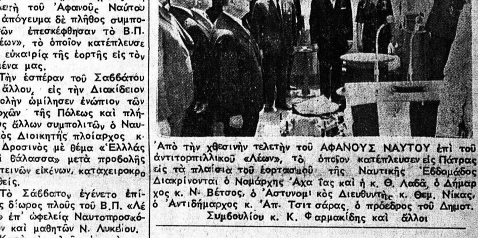
Από τήν χθεσινήν τελετήν...