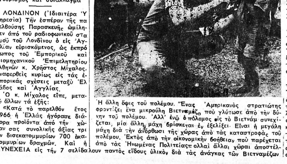
Η άλλη όψη τού πολέμου...