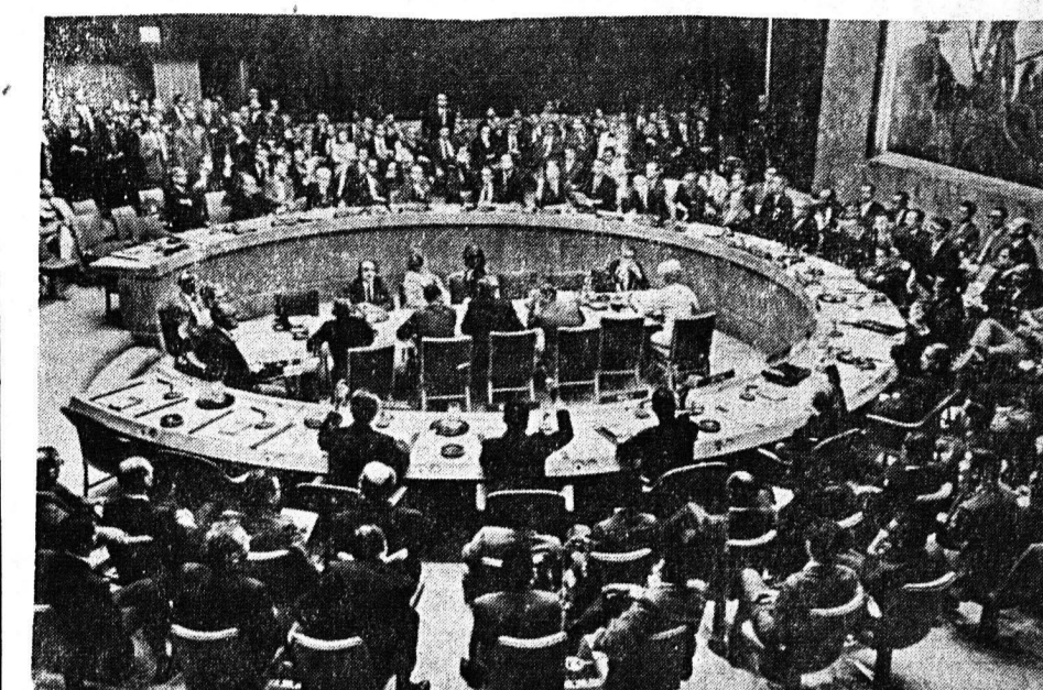
Η εικών έλιφθη την 6ην 'Ιουνίου 1967. Ήτο ή έκτακτος συνεδρίασις του Συμβουλίου 'Ασφαλείας, καθ' ην όμοφώνως και με ύμωσιν της χειρός, άπεφασίσθη ή παύσις του πυρός μεταξύ 'Ισραηλιτών και Άράβων.

ΠΑΤΡΑ Γ'ΚΗ ΤΕΧΝΟΤΕΧΝΙΑ ΤΣΙΜΑ ΤΗΛΕΦ. 70-013