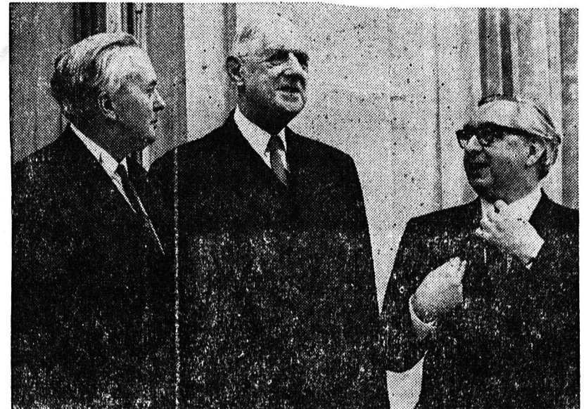
Ο Βρετανός Πρωθυπουργός κ. Χάρολντ Ουίλσον, ο Πρό έβρος Ντέ Γκώλ και ο Ύπουρ- γός Έξωτερικών, κ. Τζάρτζ Μπράουν κατά την διάρκεια διαλείμματος τών συνομιλιών των διά την Κοινήν Άγοράν εις τό Παρίσι.

ΑΘΗΝΑΙ Την 29ην λήξαντος μήνα, εις την αίθουσαν του «Παρασκευά» Αθηνών έγένε- το έπιθλητική τελετή καθ' ην άπνευμήθησαν τά βραβεία και οι έπαύται του έφετηνού δια- γωνισμού της Μαθηματικής Έταιρείας. Άφου έπρολόγησεν ό κ. Αντιπρόεδρος της Μαθη- ματικής Έταιρείας έξάρχου κ. Παπακωνσταντίνου και έπι- κολούθησε ή άπονομή των βρα- βείων και έπαύται.