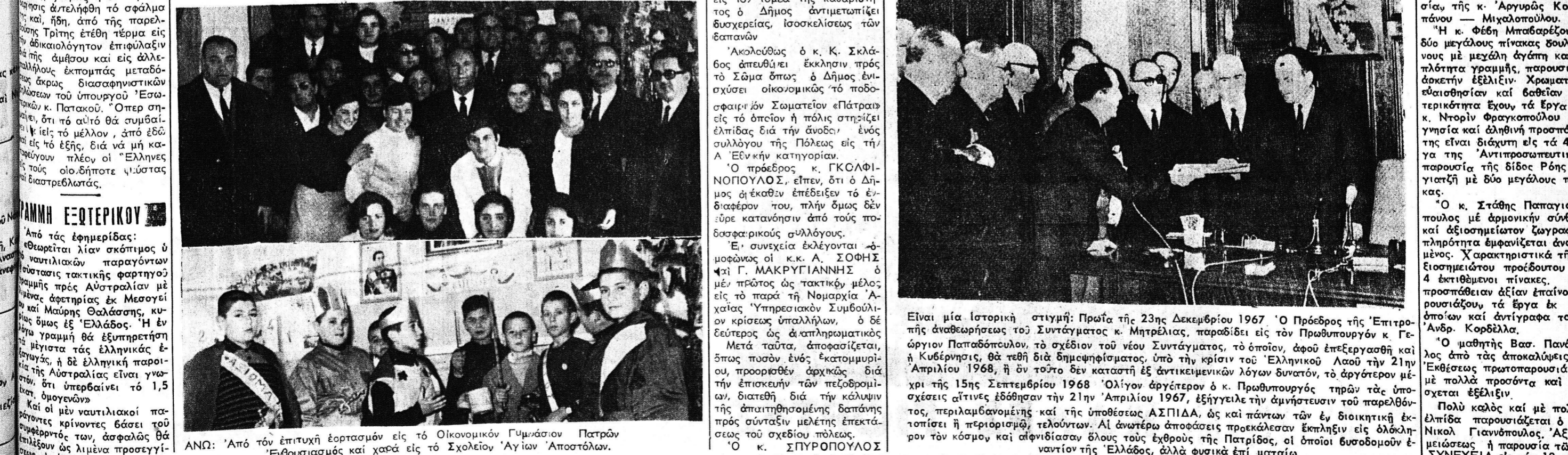
ΑΝΘ: Ἀπὸ τῶν ἐπιτυχῶν ἐορτασμῶν εἰς τὸ Οἰκονομικὸν Γυμνάσιον Πατρῶν Ἐθνοσυναισθητικὸς καὶ χαρὰ εἰς τὸ Σχολεῖον Ἁγίου Ἀποστόλου.