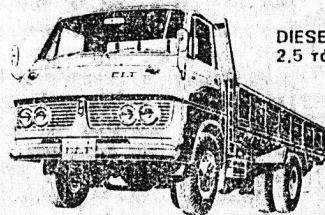
ΔIESEL 2,5 τόννου