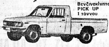
Βενζινοκίνητο PICK UP 1 τόννου

Ετοιμοπαράδοτα: (Μετά ή άνευ άμαξώματος)