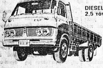
DIESEL 2,5 τόννων