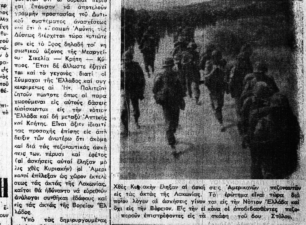
Χθές Κυριακήν έβλουν οι άσκή... σεσις Αμερικανών πεζοναύτων...