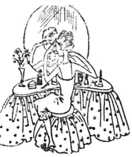
ΓΙΑ ΤΗΝ ΟΜΟΡΦΙΑ

Όταν αυτό το σύνολο είναι πειθαρχημένο γίνεται δημοφιλής αυτό (στο σύνολο) άνηκει, ά χαρακτηρισμός, κώρασις γυναικός