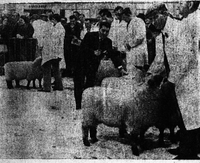
Στη Βασιλική γεωργία—κτηνοτροφική εκδοχή Στάβλου στο Λαυρίον, άπονεύονται κάθε χρόνο δραβεία στα έλεκτροτερα ζώα από όλη τή Βρετανία. Είς τήν φωτογραφίαν ο...

ΠΟΛΥΤΙΜΟΝ ΕΝΤΥΠΟΝ ΔΙΑ ΤΟΥΣ ΝΕΟΥΣ ΤΟ ΠΕΡΙΟΔΙΚΟΝ "ΠΡΟΣ ΤΗΝ ΝΙΚΗΝ," Τού καθηγητού κ. Δ. ΠΑΠΑΦΩΦΙΑΣ ΟΠΟΥΛΟΥ