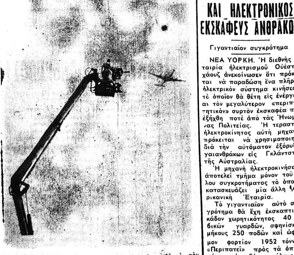
Η τηλεορασία κατακάτ... μηχανήν έχει ανυψώσθ με τον περιεργον αυτόν τρόπον εις άρκετον ύψος και λαμβάνει εικόνας όπερατέρ με τηλεοπτικήν