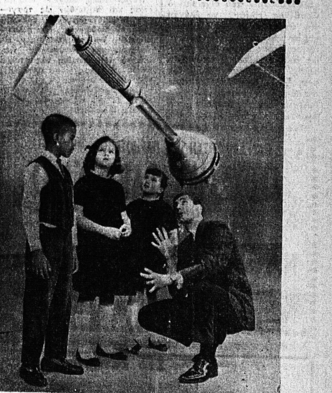
Εις τα σχολεία των Ηνωμένων Πολιτειών το μάθημα της Φυσικής διδάσκαται πλέον με νέα έπιποτικά όργανα, όπως και τό άνωτέρω. Ής γνωστόν αι εξελίξεις της έπιστήμης είναι ταχύταται και ή εκπαιδευσις όφελει να προσαρμοζέται με τον ίδιον ρυθμόν.