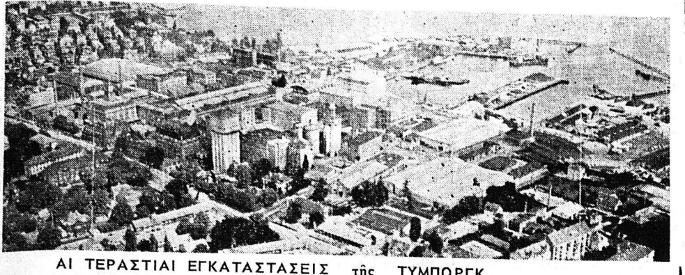
ΑΙ ΤΕΡΑΣΤΙΑΙ ΕΓΚΑΤΑΣΤΑΣΕΙΣ ΤΗΣ ΤΥΜΠΟΡΓΚ

Η Δανική μπίρα που εξάγεται εις 150 κράτη του κόσμου Το διακεκριμένο συγγραφέας κ. ΓΕΩΡΓΙΟΥ ΑΝΑΣΤΑΣΟΠΟΥΛΟΥ