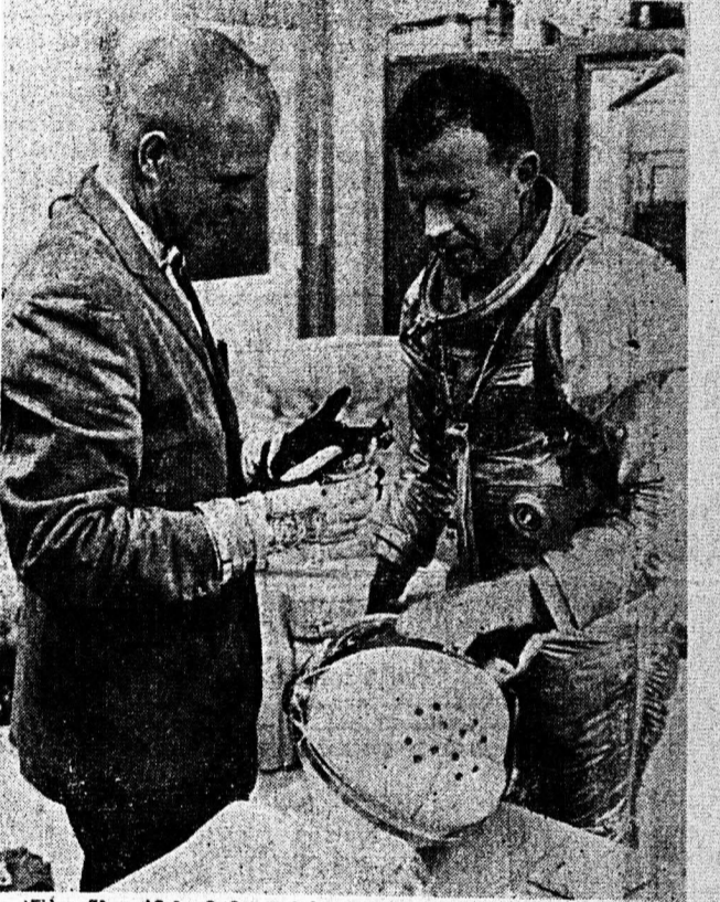
Εάν δια εξελιχθόν καλώς, αύριον εκ τού Ακρωτηρίου Κανάβεραλ...»