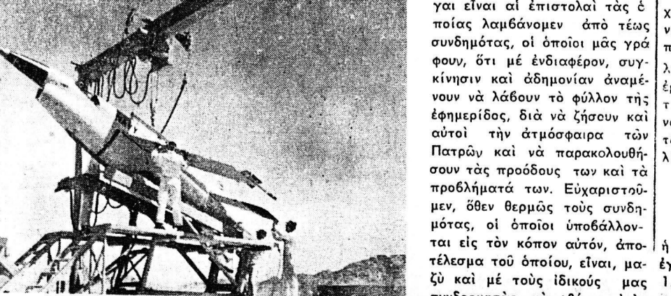
Οι τεχνικοί τοῦ Ἀμερικανικοῦ Ναυτικοῦ κατασκευάζουν ἕνα νέον πύραυλον...