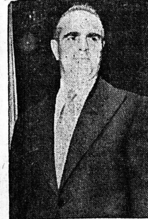
Κ. ΚΑΡΑΜΑΝΛΗΣ: Σταθρός εις την αρχική εισηγήσειν: Ήττησε και πλειοψηφικόν

Πιθανή πάντοτε ή αλλαγή του εκλογικού συστήματος.