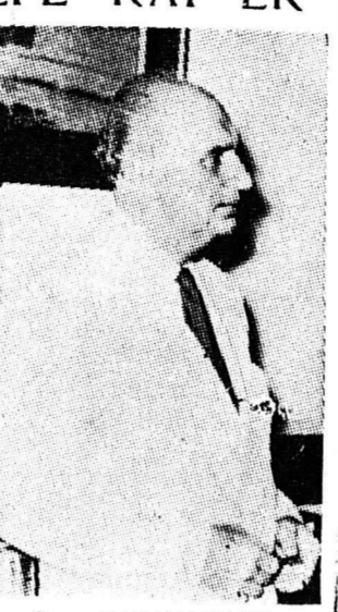
Ο Κ. ΠΑΠΑΝΔΡΕΟΥ