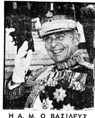
Η Α. Μ. Ο ΒΑΣΙΛΕΥΣ