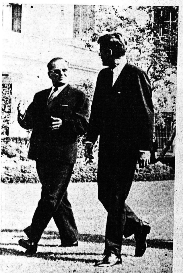
Ο πρόεδρος τής Γιογκοσλαβίας στρατάρχης Τίτο φλο- λονεύεται τās ήμέρας αὐτάς εις 'Ηνωμένας Πολιτείας υπό τού πρόεδρου κ. Κένεντυ, μετά τού όποιου και ει- κονίζεται εις έναν από τούς περιπάτους των εις τόν κή- πον τού Λευκού Οίκου

Είς ό,τι άφορά επίσης τό έκλογικόν σύστημα και τήν β' και γ' κατανομή και πάλιν ή ΕΡΕ δέν ζημιούται, παρ' όλας τας γενομένας ύ- ποχωρήσεις. Καί δέν ζημιούται διά τούς έξής λόγους: 1) Διότι ή πρώ- ή κατανομή θά γίνη άκριβ-ώς, όπως τό 1961. 2) Διότι τό εκλογικόν μέτρον δια- τήν κατανομήν τών ύπολειπο- μένων έδρών τής β' κατανο- μής θά ερρισκεται διά τής διαίρεσης τού συνόλου τών έγκύρων ψηφοδελτίων, τά