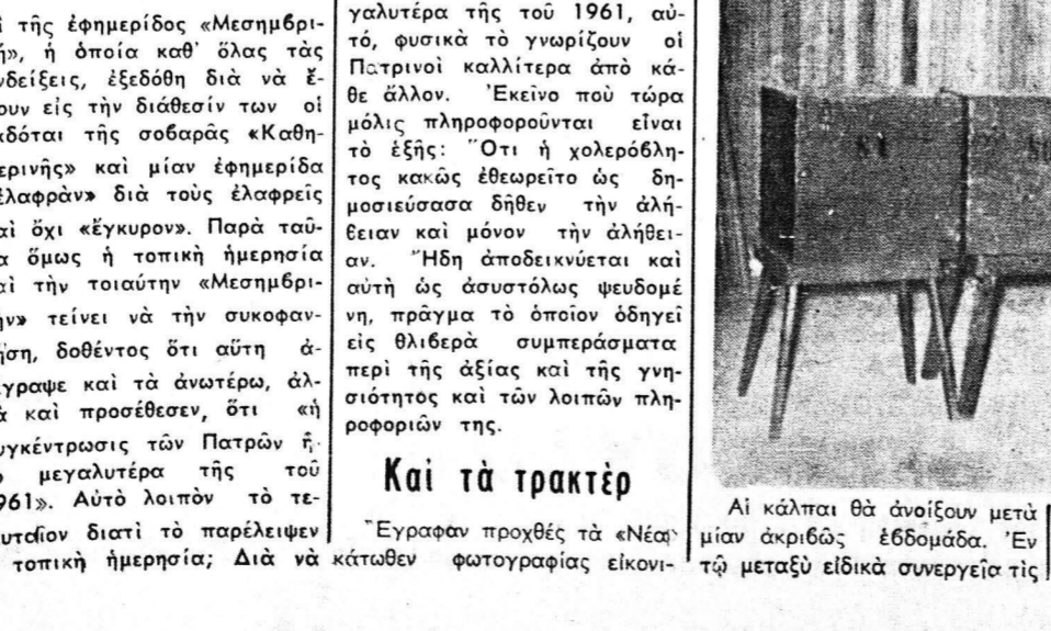
Αί κάλπαι θά άνοίσουν μετά μίαν άκριβώς έβδομάδα. 'Εν τή μετώπεί ειδικά συνεργεία τής

'Εγραψα προχθές τό «Νέα» κάτωθεν φωτογραφίας εικονι- ζομένης αγρότας επί πρακτέρ' «Αρχηγέ σάσε τούς αγρότες. Δεκάδες τρακτέρ φέρονται πλα- κτά με τό σύνημα αυτό συν- νέδουσαν τόν κ. Παπανδρόου, όχι δια να σάς ειπή τί να Ψη- φίσετε, διότι τοιαύτη σύστα- σις, επί τούτου θέματος θά ήτο και έκτός χρόνου, και πρό πάντως έκτός τόπου, άλλ- λά ίνα σάς ειπή άπλάς και έκ καθήκοντος τήν γνώμην του. Καί ή γνώμη τού αύτου συνίσταται εις τό ότι ο έλλη- νικός λαός, θά πρέπει και αύτήν τήν φοράν, χάριν τής τσόν επίθυμητης και αναγ- κείας προόδου τής χώρας να ρίψη τήν ψήφον του ύπερ τής ΕΡΕ. Είς τήν γνώμην αύτήν έ- κει καταλήγει ο 'Εθνικός Κή- ρυξ' όχι διότι θεωρεί τήν Ε. Ρ. Ε. άντιδικτατοκρατον, άλλ- λά διότι δυστυχώς ή 'Αντιπο- λιτευσις λόγω έσωτερικής διαθρνώσεως δέν παρέχει ά- κόμη έγγύτητα εις δύναται να συνεχίσθι, ως θά τήν συνεχίσθι άποσπασθί τής ΕΡΕ, τήν πο- ρείαν τού Έθνους πρός ένα καλλίτερον μέλλον.