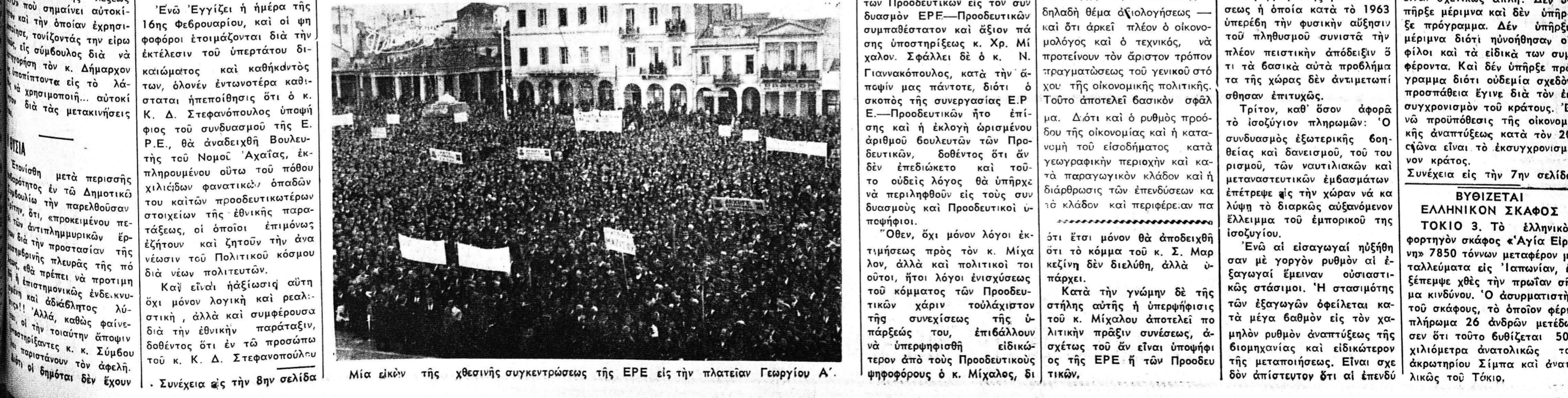
Μία εικόν της χθεσινής συγκέντρωσης της ΕΡΕ εις την πλατείαν Γεωργίου Α'.