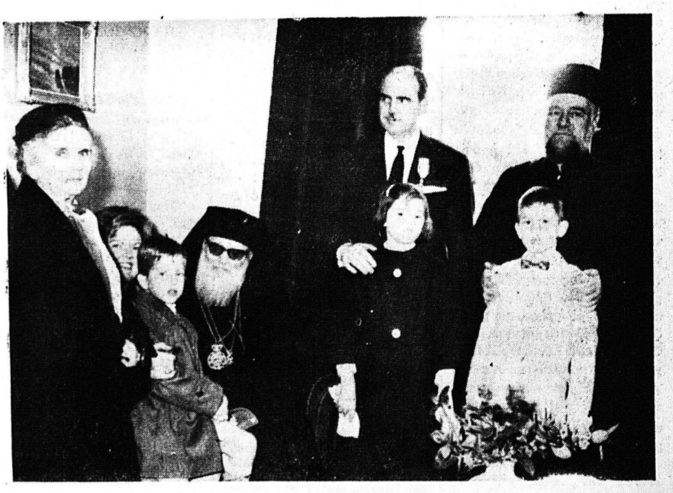
Τὸ θρησκευτικὸν αἶσθημα εἰς τὴν καθῆκον τὸν Καθηγητὴν 'Ανδρέα Γ. Παπανδρέου. Διὰ τοῦτο ὁ Πατριάρχης 'Αλεξανδρείας Χριστόφορος ἀπέειπε τὴν 22/1/64 εἰς αὐτὸν τὸν Σταυρὸν τοῦ 'Αποστόλου καὶ Εὐαγγελιστοῦ Μάρκου ὡς δεῖ γὰρ καὶ ὡς ἀνεκέρητο εἰς τὸν πατριάρχικόν γράμμα «ὀρατὸν τὴν ἀποστολικὴν εὐλογία».

Ὁ δημοσιογράφος κατέβη εις τήν περιφερειάν του νομού, όπου διεξάγει την προεκλογική του πορεία. Ο δημοσιογράφος κατέβη εις τήν περιφερειάν του νομού, όπου διεξάγει την προεκλογική του πορεία.