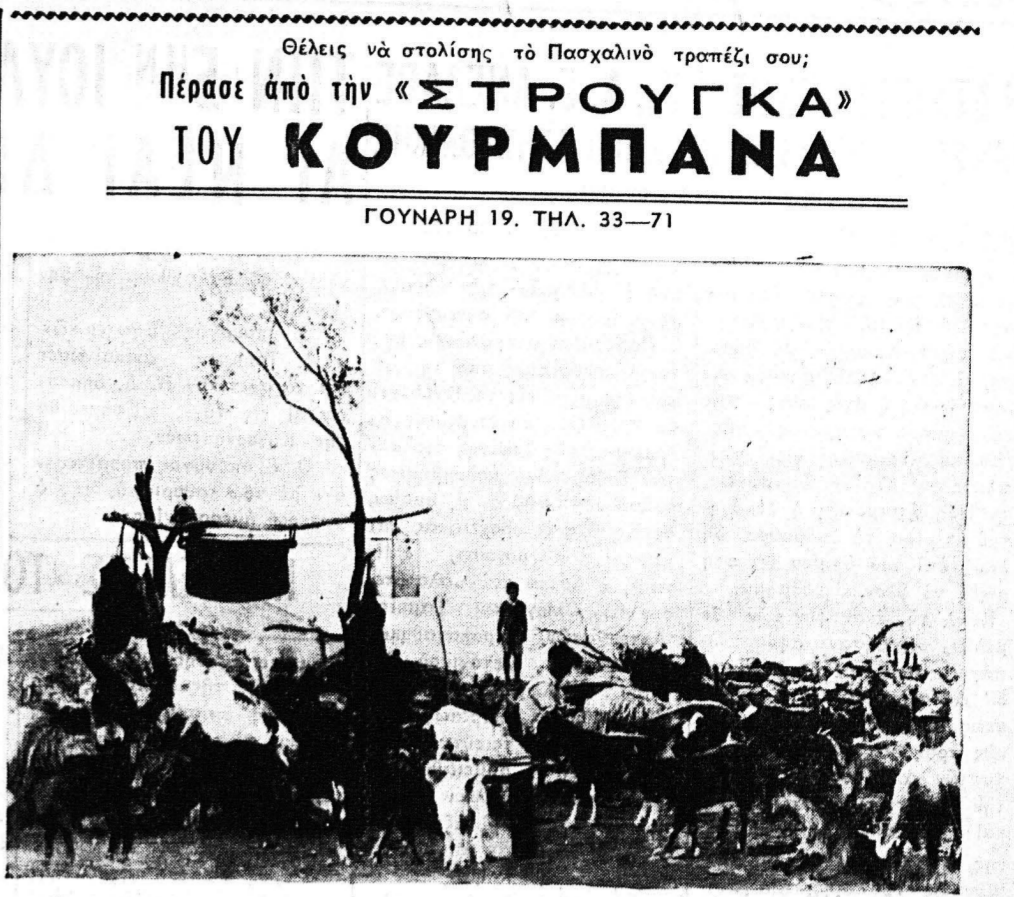
'Εκεί θα βρης τα φημισμένα κεφαλοτύρια «ΚΟΥΡΜΠΑΝ Α», φέτες όλόσχαes, γιαούρτες έλεκτές, καφέρια και δούτυρα γίβινα Βυτίνας και ό,τι έλεκτό θέλεις.

ΟΙ ΟΥΝΙΤΑΙ Συνέχεια εκ της 4ης Σελίδος κάτον. Ευτυχώς όμως και ό τότε πρωθυπουργός της 'Ελλάδος, Θ. Σοφούλης άπηγγέρισε την θεώρησιν διαβατήριου εις τον ύποψηφον ντελεγκάτον και του έματαιώσε την κάθισον, προς λύτην βέβαια τώ, Ουνιτών οι όποιοι έ χαρακτηρίσαν «θλιβερό» τό πράγμα εις τό φυλλάδιό τους «ό προσλητισμός έν 'Ελλάδι». Είναι τόσα πολλά τα περί Ουνίας που δέν, τελειώνουν. 'Εμείς όμως κάποτε πρέπει να τελειώσουμε και να μην άπασχολούμε την φιλόδοξη αυτή στήλη με τό ίδιο θέμα. Δέν άπομένει παρά νό δοίμε έν ένειν ποθητή, εάν είναι δυνατή ή ύπό του Βατικανού επίδιωκομένη «ένισχυσις των 'Εκκλησιών». ΟΥΡΑΝΙΑ Γ. ΛΑΜΠΑΤΟΥ