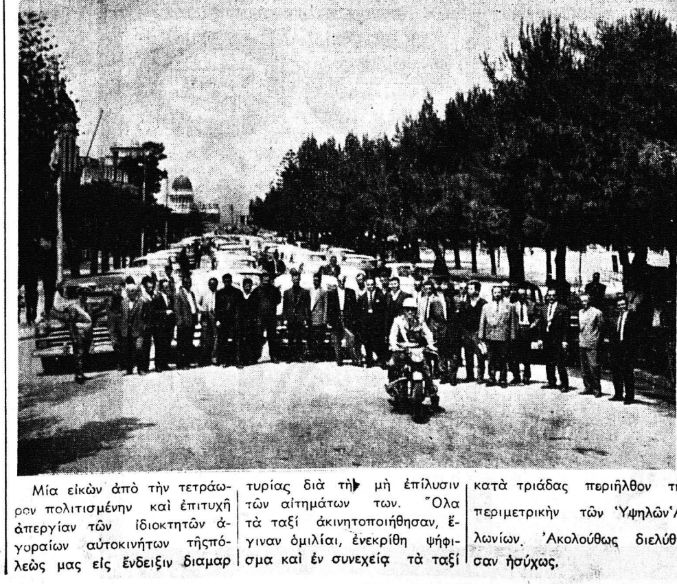
Μία εἰκόνα ἀπὸ τὴν τετάρτων πολιτικῶν καὶ ἐπιτυχῶν ἀγροτῶν τῶν ἰδιοκτητῶν ἀγροτῶν αὐτοκινήτων τῆς πόλεως μὲς εἰς ἔνδειξιν διαμαρτυρίας διὰ τὴν μὴ ἐπιβίωσιν τῶν αἰτημάτων των. Ὅσα τὰ ταξί ἀκίνητοποίησαν, ἔγιναν ὁμίλια, ἐνεκρίθη ψηφισμα καὶ ἐν συνεχείᾳ τὰ ταξί κατὰ τριάδας περιήλθον τὴν περιμετρικῶν τῶν Ὑψηλῶν Ἀλωνίων. Ἀκολουθῶν διεδήσαν ἡσυχῶς.