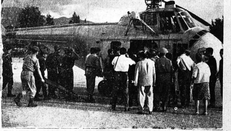
ΕΝΑ ΑΠΟ ΤΑ ΕΛΙΚΟΠΤΕΡΑ ΠΡΟΣΓΕΙΩΜΕΝΟΝ ΕΙΣ ΤΟ ΣΤΑΔΙΟΝ ΤΟΥ Κ. Ε. ΤΕ. Σ. ΟΙ ΤΡΑΥΜΑΤΙΟΦΟΡΕΙΣ ΠΑΡΑΛΑΜΒΑΝΟΥΝ ΤΑΧΕΩΣ ΤΟΥΣ ΑΣΘΕΝΕΙΣ