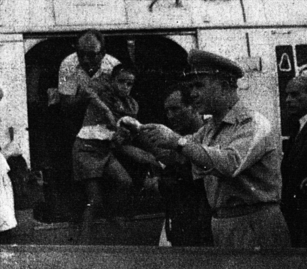
ΣΤΡΑΤΙΩΤΗΣ ΤΟΥ ΚΕΤΕΣ ΜΕΤΑΦΕΡΕΙ ΕΝΑ ΚΟΡΙΤΣΑ ΚΙ ΘΥΜΑ ΤΟΥ ΤΡΑΓΙΚΟΥ ΛΑΘΟΥΣ