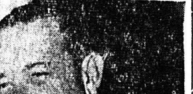
Ο Κ. ΤΖΟΝΣΟΝ