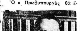
Ο Κ. ΘΑΝΤ