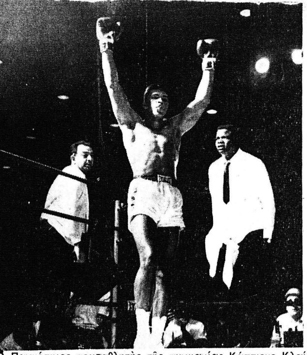
Ὁ Παγκόσμιος πρωταθλητὴς τῆς πυγμαχίας Κασίσιος Κλαῖου ἀνακηρυχθεὶς νικητὴς κατὰ τὸν ἀγῶνα τοῦ ἐναντίου τοῦ πρῶτου τοπυγμάχου Σόνου Λίστου.

Κατὰ πληροφορίας ἐκ τῆς Κωνσταντίνης Ἀκτῆς, ὁ Ντὶ Στέφανο πρόκειται νὰ μεταγραφῇ εἰς τὴν Μίλαν καὶ ὁ Ντῶς εἰς τὴν Ρεάλ Μαδρίτης.