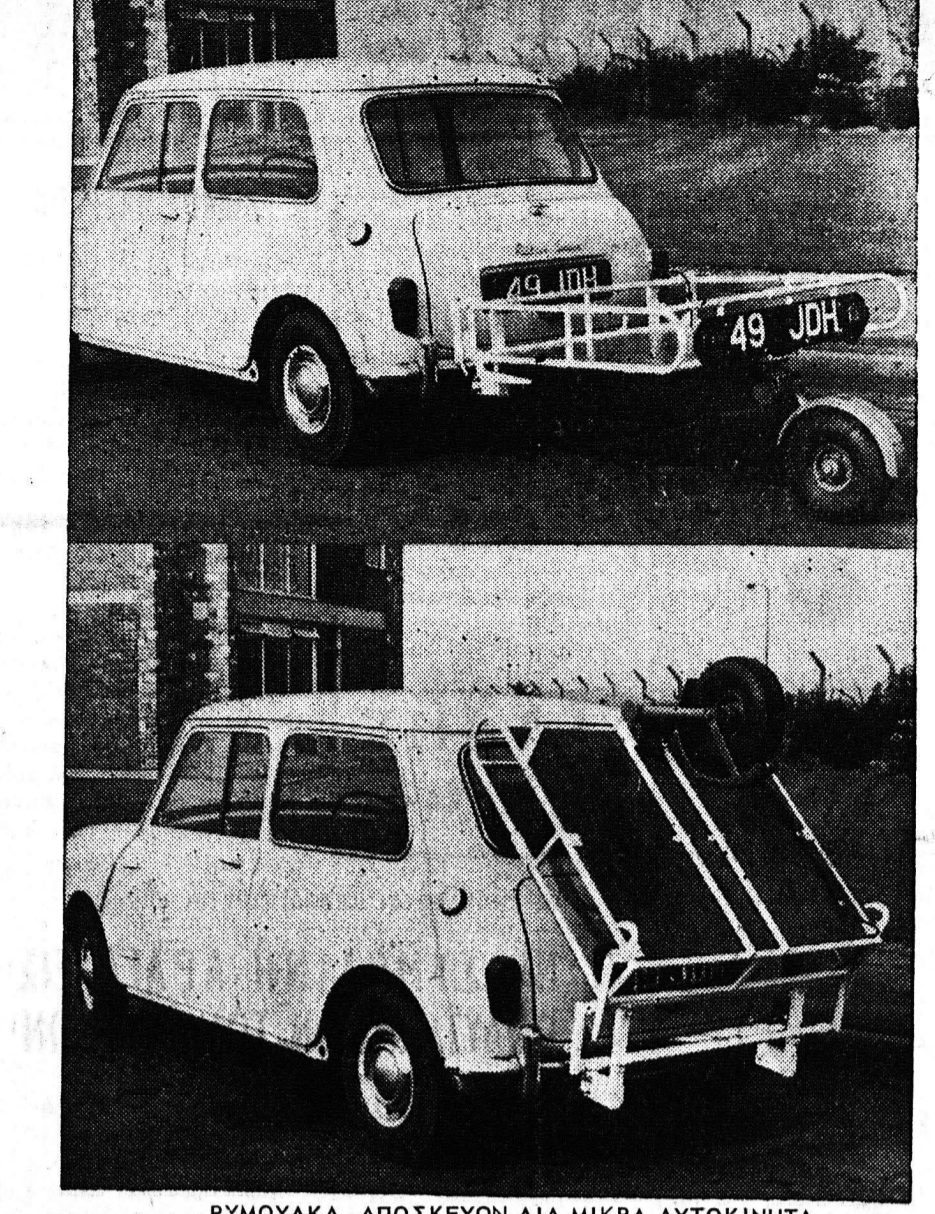
ΡΥΜΟΥΛΑΚΑ ΑΠΟΣΚΕΥΩΝ ΔΙΑ ΜΙΚΡΑ ΑΥΤΟΚΙΝΗΤΑ 'Η «Τραϊνλέτ», είαι μία νέα ρυμύλακα άποσκευών διά μικρά αυτοκίνητα. Σηκώνει βάρος 160 λιμπρ. και είναι άπόλυτος άσφαλής εις ταχύτητα μέχρι 70 μιλ. τήν ώραν. 'Η «Τραϊνλέτ» διπλώνεται ώστε να μην καταλαμβάνη χώρο όταν τώ αυτοκίνητον φορτώνεται εις πορμπείον, άεροπορμπείον ή παρκάρεται εις τώ γκαράζ.

2. «Κατά τήν πίστιν ήμιν γεννηθήτα ήμιν». Αυτή ήτο και ή άπάντησις του Κυρίου. «Ερώτησε τους δύο τυφλούς ο Χριστός. Πιστεύετε πώς έμπαρόν έγώ να σας άνοίξω τά μάτια και να σας δώσω τώ φώς των οφθαλμών σας; «Ναι, Κύριε, τώ άπαντων οι τυφλοί. Και ο Χριστός τους λέγει. Κατά τήν πίστιν, που έχετε, άς γίνη. Να γίνη τώ θαύμα, άφοσ πιστεύετε εις τώ θαύμα. Να άνοίξουν τά μάτια σας και να λάβετε τώ φώς σας, άφοσ με παραδέχαστε φωτοδότην σας. Κατά τήν πίστιν σας. Διότι κανείς είναι να λάβη, άφοσ έχει τώ κεφάλαιον. τήν δάμνη και τήν άρχήν τής σωτηρίας σου, τήν σταθεράν και άκλόνητον πίστιν σου. Διότι τώ θαύμα, ή θαυματουργική θεραπεία και ίασις, από μιά άρρώστια σωματική ή ψυχική, προϋποθέτει τήν πίστιν και καρπός τής πίστεως είναι τώ θαύμα. Αυτή έλλας τε, ή θερμή και άκλόνητος πίστις εις τώ Θεού τήν δύναμιν και εύσπλαχνίαν θα κινήσει και εις άλλωτερον και έπίμονον προσέχην προς τόν Κύριον και Σωτήρα, διά να ζήτη ή και έπιείλη ή θεραπεία. Κράζει κανείς και ικετεί και επικαλείται τήν θείαν άρωγήν και ζητεί τώ Θεω του Κυρίου, όταν πιστεύη. «Αν δεν πιστεύη, τί να ζήτηση; Αν δεν έχη μέσον τώ ζωντανήν τήν πεποίθησιν, ότι μπορεί και θέλει να τόν σώση ο Σωτήρ, να τόν θεραπεύση από μιά άρρώστια, να τόν λυτρώση από μίαν θλίψιν, από ένα πειρασμόν, πώς να τόν επικαλεσθή; Οι δύο τυφλοί έπειδή έπίστευσαν, δια τού τώ και ζήτησαν. «Ανάλογα με τήν δύναμιν τής πίστεώς των ήταν και ή δύναμις τής