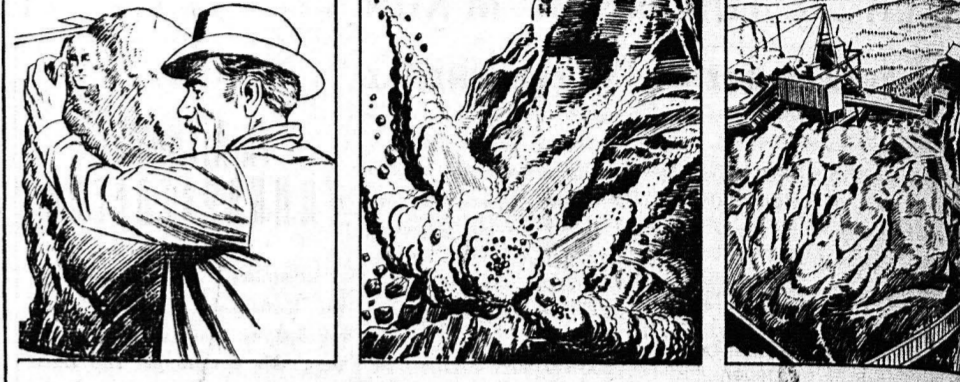
Η ΙΔΕΑ — Ο Μπόργκλουμ σκέφθηκε ότι τό γλυπτικό έργο Ράσμοουρ έπρεπε να αποτελέσουν ένα είδος έθνικού βουνα άναμνηστικού στίς άρχές και τά Ιεσοδία τής Άμερικής.