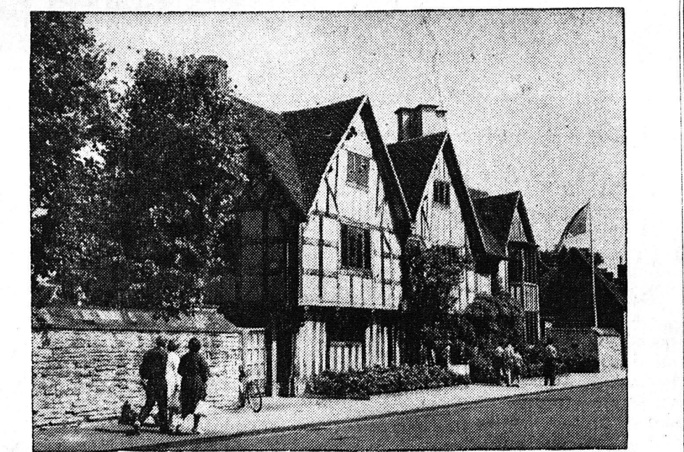
Τό Χώλλς Κρόφτ εις τό Στράτφορντ—άπόν—Αϊηδον όπου έζησε ή κόρη του Σαίξπηρ Σούζαννα. Με την εύκαιρία της 400ής έπετειού της γεννήσεως του Σαίξπηρ θαμμάται από όλον τόν κόσμον έπισκεπτάται την γεννικειραν του.

ΑΝΤΙΠΡΟΣΩΠΟΙ ΝΟΜΟΥ ΑΧΑΪΑΣ ΑΦΟΙ Κ. ΜΑΛΛΙΑΡΗ ΡΗΓΑ ΦΕΡΡΑΙΟΥ 132 ΤΗΛ. 66-88 ΠΑΤΡΑΙ