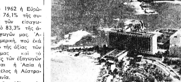
Αυτήν την εικόνα παρουσιάζει το κτηριακόν ξενοδοχειακόν συγκρότημα του Χίλτον εις το Πόρτο Ρίχο, όπου χιλιάδες τουριστάσιν αμρρικάνων κατ' έτος αδιδάσκονται. Είς την ίδιαν περιήν ύψούνται ως μεγαθήρια άλλα ξενοδοχεία.