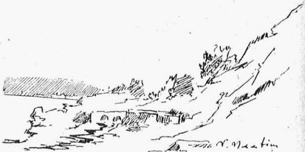
Ἡ πηγὴ τοῦ Διονύσου ἢ λεγομένη "Ἀη-Λαγούδης.

Ὅλιγα εἶνε τὰ ἐμπορικὰ καταστήματα τῆς πόλεως καὶ αὐτὰ πολὺ φτωχικά. Οἱ δὲ ὀλίγοι ἐν αὐτῇ ξένοι, ὅταν θελήσουν νὰ ψωνίσουν κάτι καλόν, προτιμοῦν νὰ πεταχτοῦν στὸν Πύργον ἢ στὰς Καλάμας, γιατί εἰς τὴν σημερινὴν Κυπαρισσίαν δὲν βρίσκουν τίποτε!. Καὶ ἂν βρίσκουν κάτι, θὰ εἶνε πάντοτε εἰς ἀπίστευτον βαθμὸν ὑπερτιμημένο!