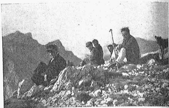
Στὸ Ψηλό: Τὸ φίλημα τοῦ Ἡλίου.

Ξαπλωθήκαμε στὰ λιθάρια. Ὁ Φίλιππος εἶχε πέσει κατα-