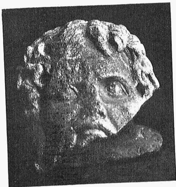
Εἰκ. 4 — Μαρμάρινη κεφαλὴ, ὑπερφυσικῆ μεγέθους, τοῦ αὐτοκράτορος Σεπτιμίου Σευήρου (193-211 μετὰ Χρ.).

κατόπι ἐκδοθὲν ἀξιολογώτατο βιβλίον του le mont Olympe et l'Ascaranie (Paris 1860) θεωρήσας αὐτὸν μετὰ βεβαιότητος παλαιότερον τῶν περὶ τὸν Αὐγουστον ῥωμαϊκῶν χρόνων ἐγγώριον Μακεδονικὸν κτίσμα. Εὐρέθη συλημένος καὶ αὐτός, ἀνοικτὸς δέ, ὅπως εἶνε καὶ σήμερα, καὶ ἐνδιαί-