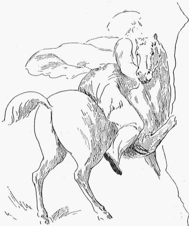
Εἰκ. 8—Ὁ πρῶτος ἵππεὺς τῆς ζωοφόρου τῆς νεκρικῆς κλίνης.

θέσι εἰς αὐτή, δὲν ξαίρω κατὰ ποιά τύχη—ἐσχημάτιζε τετράγωνο προσκολλημένο εἰς τὸν ὀπισθεν τοῖχον μὲ πλευρὰν μ. 1,80 καὶ ὕψους ἑνὸς μέτρου. Τὰ μάρμαρα αὐτῆς μὲ τὰ τεμάχια τῆς δίφυλλης μαρμάρινης θύρας εὐρήκα ἀπὸ