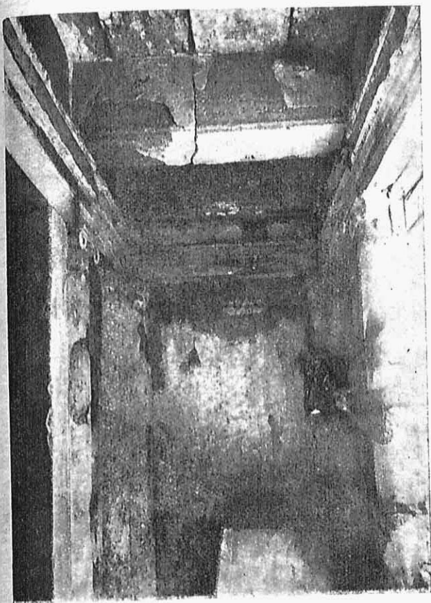
Εικ. 6 — Ὁ προθάλαμος τοῦ τάφου.