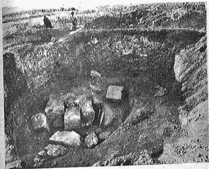
Εἰκ. 1 — Ἡ ὁπὴ εἰς τὴν ἀψίδα.

Ὁ τύμβος ποὺ τόσο γρήγορα στὴν πρώτη δοκιμὴ δείχθηκε ὅτι ἐσκέπαζε ἓνα σημαντικὸ οἰκοδόμημα τάφου, κεί-