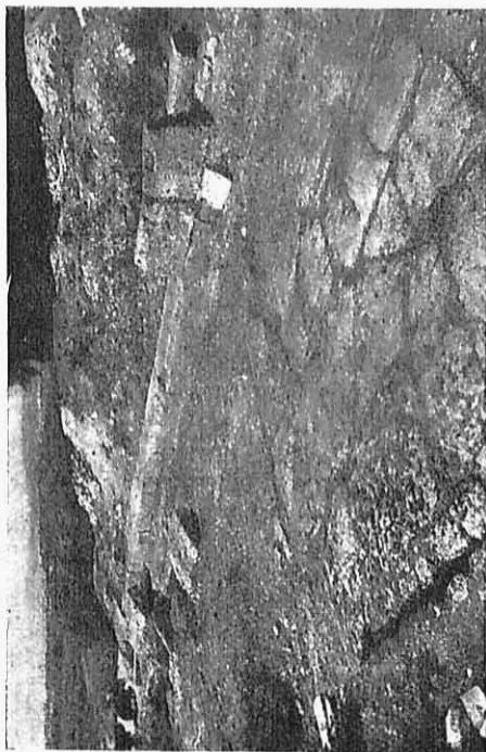
Εἰκ. 9 — Πλακώστερος ὁδὸς τῆς πόλεως Δίου, πλάτους μ. 5,60.

εἰς ὅ,τι μᾶς προσφέρουν αὐτὲς ὑπερβαῖνον κατὰ τὴν ἀντίληψί μας τὴν ἰδέα πὺν ἔχομε περὶ τῆς πολιτιστικῆς θέσεως, τὴν ὁποία καὶ ὡς πρὸς τὴν καλλιτεχνία κατέλαβε πολὺ ἐνωρίτερα ἀκόμη, καὶ εἰς πολὺ ἀνώτερον βαθμὸν παρ' ὅσον νομίζομε